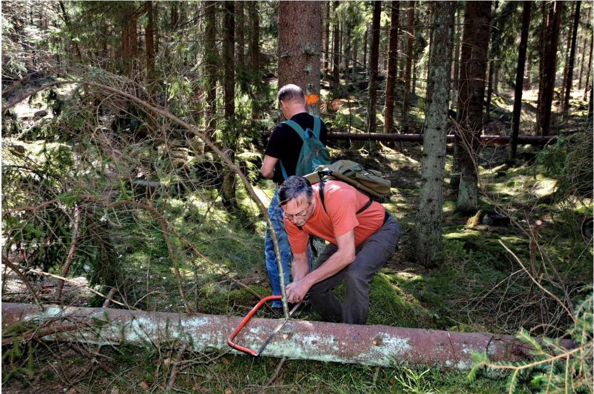
Vindfällor ett återkommande problem.